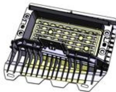
Reforço plástico do airbag

O item é aplicado no reforço plástico do airbag montado no painel de instrumentos automotivo.