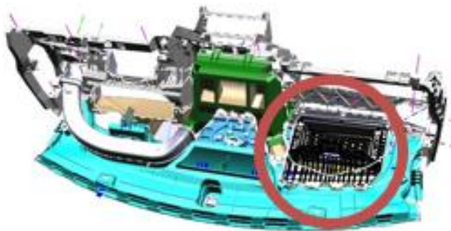
Painel de instrumentos